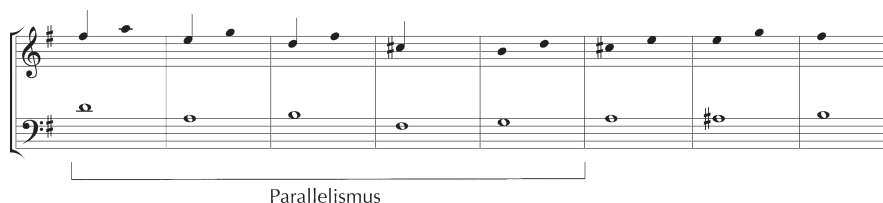
Beispiel 3: Sting, Englishman In New York , Satzmodell der Bridge

Bis zu diesem Zeitpunkt entspricht der Songverlauf den Erwartungen an eine Verse-Chorus-Bridge-Form. Doch anstelle eines Verse oder Chorus folgt nun ein Abschnitt im Stil einer Jazz-Improvisation (solistisches Saxophon, ternäre Spielweise, Walkingbass etc.), der einen weitaus stärkeren Kontrast zu den bisher erklangenen Formteilen bildet als die vorangegangene Bridge. Für einen solchen Formteil wird hier der Begriff ›Solo‹ bzw. ›Instrumental Solo‹ vorgeschlagen. Eine solistische und elektronisch verfremdete Schlagzeugphrase, die in ihrer Formfunktion an eine entsprechende Stelle in Poor Man's Moody Blues von Barkley James Harvest (1977) erinnert, führt in Englishman in New York zurück zu einem Verse. Ihm schließen sich noch ein weiterer Verse sowie zwei Chorus-Gestaltungen an, in denen die Schlussphrase vom Verse sowie die Headline des Chorus zugleich erklingen (was durch die gemeinsame harmonische Grundlage von Verse und Chorus ermöglicht wird). Ein Outro (solistisches Saxophonspiel mit Fade-Out) beendet den Song.