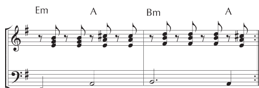
Beispiel 2: Sting, Englishman In New York , Harmoniemodell für Verse und Chorus

Auffällig ist, dass Verse und Chorus auf dem selben Harmoniemodell basieren und dass sowohl eine Refrainzeile (»I'm an Englishman in New York«) als auch ein Refrain (»I'm an alien, I'm a legal alien, I'm an Englishman in New York«) vorhanden sind: