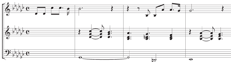
Beispiel 1: ABBA, The Winner Takes It All , a) Verse (Anfang), b) Chorus (Anfang)

The winner takes it all The loser standing small Beside the victory That's her destiny